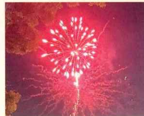
40回を迎えた香澄まつり 夜空を彩る夏花火