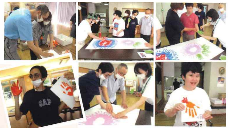
総合福祉センターの一角を華やかに飾りました

手形 de アート 唯一無二の“打上げ花火とロバ” 体温が伝わるような温かさに溢れた作品づくりを。実寸大の魅力が凝縮される手形をぺたぺた～触れて眺めてほっこり～かけがえのない一瞬が詰まっています。