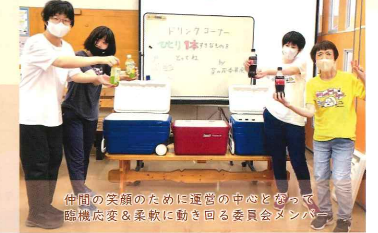
仲間の笑顔のために運営の中心となって 臨機応変 & 柔軟に動き回る委員会メンバー