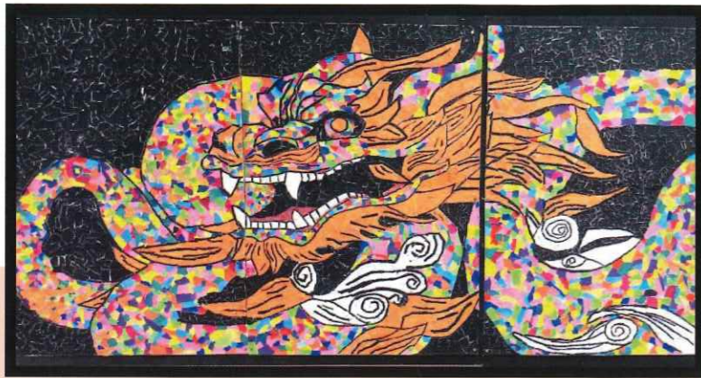
作品テーマは今年の干支である「辰」と認知症啓発のシンボルカラー「オレンジ」 半年間の制作月日を重ね、模造紙3枚に及ぶカラフルで迫力ある壮大な作品が完成しました。

ちぎり絵のワークショップ 作品を共に創る協働制作 4月から9月まで毎月1回、センターを利用される方々と職員の皆様、花の実園のメンバーとスタッフが協力して1枚のちぎり絵を創り上げていく交流活動。 地域と共に歩み、心を重ね深め合った絆が優しさの層となり、共生社会を成し遂げています。