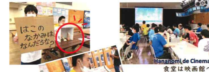
Hananomi de Cinema 食堂は映画館へ

作業しない特別な夏の日を自由に愉快地味わおう。 ワクワク感は準備の段階からも楽しく、日常とのメリハリで意欲も生産性もアイデアも量産します。